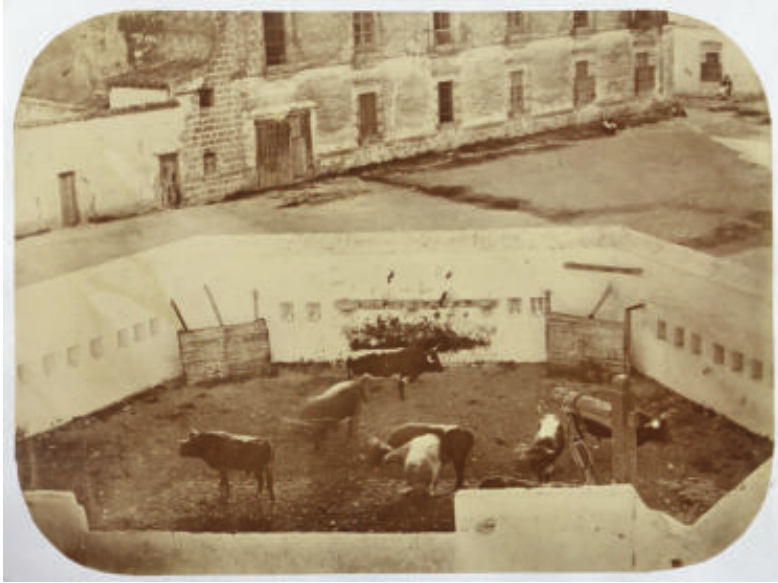
Fig. 2. Conde de Vernay. Toriles de la corrida del 25 de julio de 1859 en El Puerto de Santa María. Positivo a la albúmina, 244x180 mm