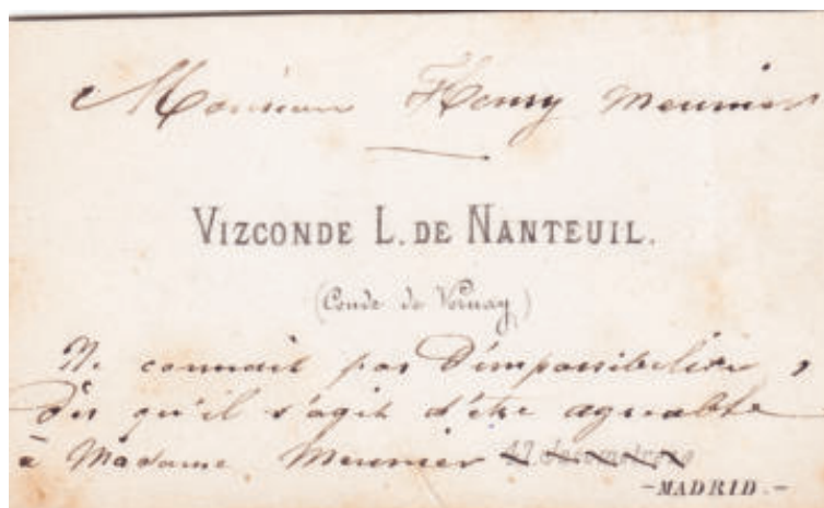
Fig. 5. Tarjeta de visita del conde de Vernay.

nobiliario: en la petición que hace a la reina para ser nombrado fotógrafo de la Real Casa, en el padrón de habitantes de Madrid de 1863, y en una tarjeta de visita (de las normales, no fotográficas) [Fig. 05]. En todos estos documentos, junto al título de conde de Vernay, figura el de vizconde de Nanteuil, un título nobiliario que sí aparece en los repertorios dedicados a la aristocracia francesa 18 .