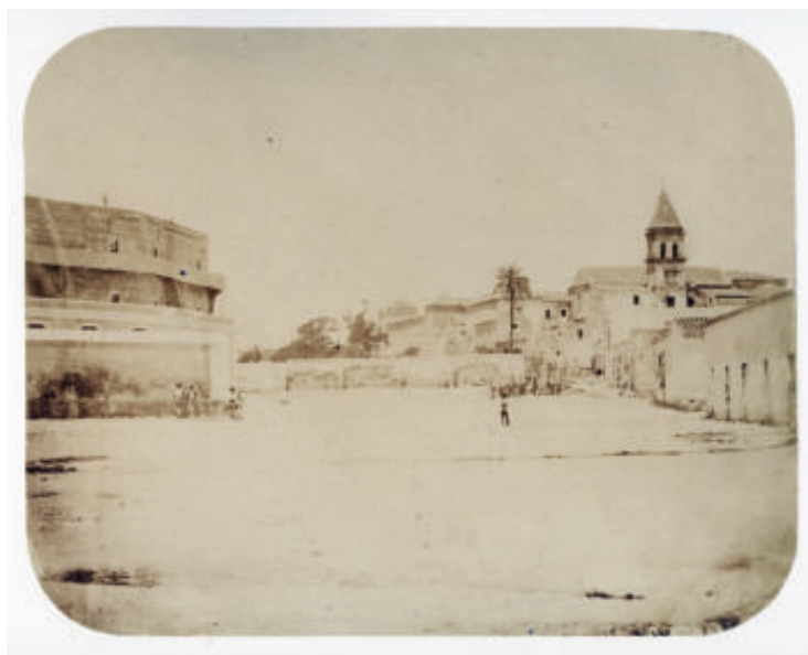
Fig. 4. Conde de Vernay. Exteriores de la plaza de El Puerto de Santa María. Positivo a la albúmina, 240x190 mm.

Las vistas son tan claras y los animales y las personas salen tan poco movidos que corroboran las palabras del conde años después, cuando afirma haber conseguido “ reproducir instantáneamente ” los episodios de la corrida 8 . Instantáneamente es el término que utiliza también el conde en enero de 1863, cuando anuncia retratos a caballo en el circo Price de Madrid 9 .