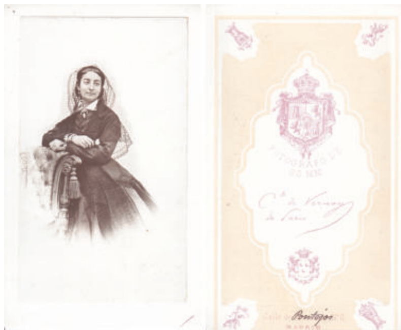
Fig. 7. Conde de Vernay. Tarjeta de visita de Ponteijos 6. Positivo a la albúmina.

En alguna trasera de las tarjetas cabinet de este periodo (ya con la dirección de Montera 44) se anuncian: