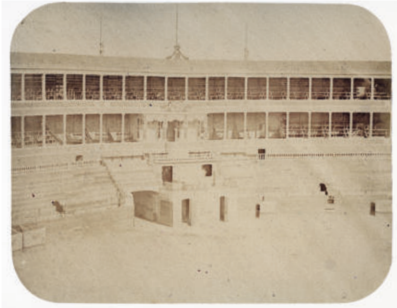
Fig. 3. Conde de Vernay. Plaza de El Puerto de Santa María. Positivo a la albúmina, 240x190 mm. col. Carlos Sánchez