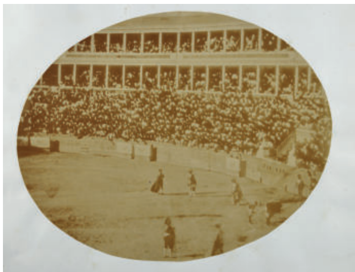
Fig. 1. Conde de Vernay. Escena de la corrida del 25 de julio de 1859 en El Puerto de Santa María. Positivo a la albúmina, 240x190 mm

Ese día se lidiaban ocho toros, los diestros eran primeros espadas –Cúchares y los tres hermanos Carmona, Manuel, Antonio (alias Gordito) y José– y, lo que es más importante, presidían los duques de Montpensier, verdadero motivo del reportaje fotográfico. La serie de fotografías que hace Vernay no podía haber sido más completa, porque no sólo recoge momentos importantes de la faena [Fig. 1] –la salida de un toro, las suertes de varas y banderillas, un pase de muleta y la cogida de Manuel Carmona en el primero de la tarde 5 – sino también escenas de lo que sucede en torno a la lidia, como los toros en los corrales [Fig. 2], además de una imagen de la plaza vacía como monumento arquitectónico, igual que Edward King Tenison había fotografiado la Real Maestranza de Sevilla a comienzos de la década 6 , y con la tribuna que ocupaban los duques de Montpensier 7 [Fig. 3], y una vista urbana junto a la plaza de toros [Fig. 4].