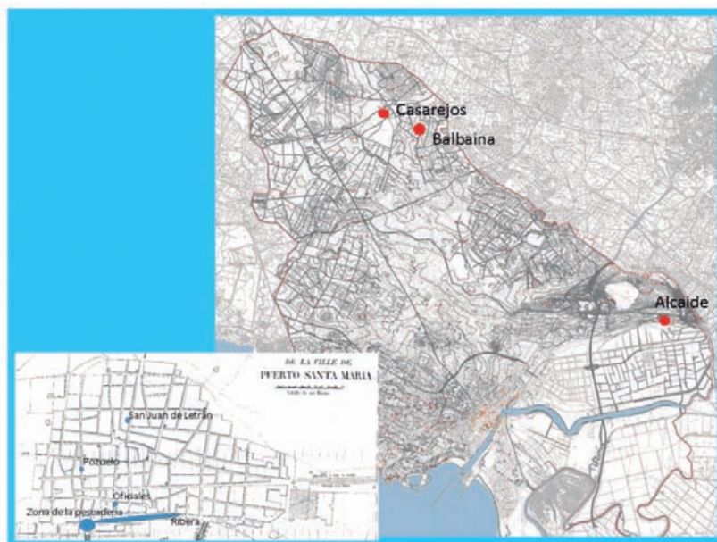
Fig. 1. Plano de El Puerto de Santa María y su alfoz

En el callejero actual de la ciudad hemos localizado las conocidas calles de la Ribera, San Sebastián y, creemos que refiriéndose a la calle Luna (o quizá calle Palacios), la que se recoge como “ la calle que va a la iglesia ”. El resto no conseguimos situarlo en dicho callejero, pensando que deben haber cambiado su denominación, como ha ocurrido en tantas ocasiones a lo largo de la historia. Gracias a la amabilidad de D. Miguel-Ángel Caballero, quien ha accedido a facilitarnos el mapa que sigue, podemos observar la ubicación de algunas de las calles mencionadas, así como de los pagos rústicos, a los que hacemos referencia en el cuadro anterior.